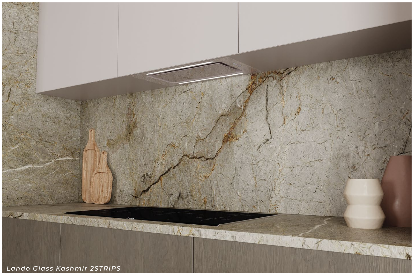
Lando Glass Kashmir 2STRIPS

Bazowa produkcja naszych okapów odbywa się w Polsce, zaś komponenty do realizacji projektów sprowadzamy wyłącznie od miejscowych dostawców, sporadycznie z pozostałych części Polski lub innych krajów Europy.