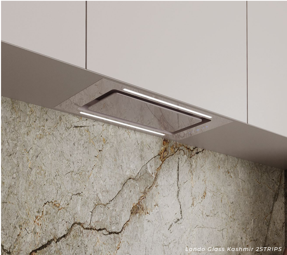
Lando Glass Kashmir 2STRIPS