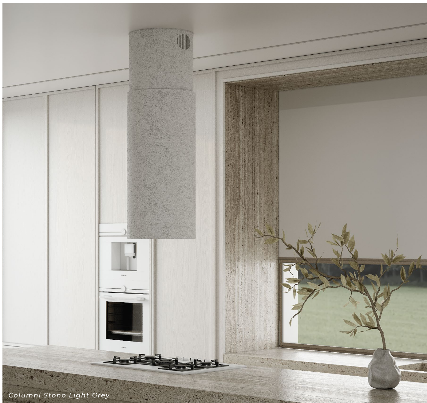
Columni Stono Light Grey

Odkryj najnowsze trendy wnętrzarskie z okapami Integra, Prato i Columni Stono. Okap blatowy Integra to doskonała fuzja zaawansowanej technologii i minimalistycznej estetyki – wbudowany w płytę indukcyjną, gwarantuje dyskrecję i funkcjonalność w jednym. Prato , podszafrkowy okap z elegancką szklaną klapką, to esencja nowoczesnej subtelności, która dodaje wnętrzu lekkości i stylu. Natomiast Columni Stono , z powłoką wykonaną z betonu architektonicznego, stanowi wyrazisty i industrialny akcent, idealny dla miłośników surowej, nowoczesnej architektury. Każdy z tych okapów to wyjątkowe połączenie funkcji i designu, które wprowadza elegancję na wyższy poziom.