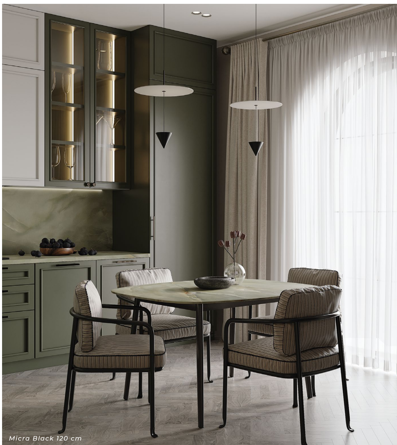
Micra Black 120 cm

Najdłuższy okap tego typu dostępny na rynku, co czyni go idealnym rozwiązaniem dla osób poszukujących maksymalnej efektywności w kuchni. Micra 120 to nie tylko okap, ale także symbol innowacyjności i wydajności w kuchennym środowisku.