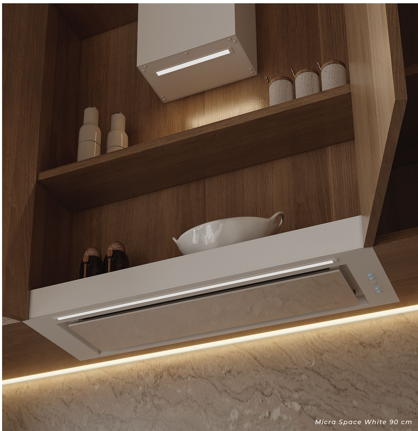
Micra Space White 90 cm

To okap do zabudowy, który rewolucjonizuje przestrzeń kuchenną. Minimalistyczny design, doskonała funkcjonalność i ciche działanie sprawiają, że to idealny wybór dla Twojej kuchni. Micra Space łączy w sobie nie tylko doskonałą wydajność, ale także wygodę, zapewniając użytkownikom więcej miejsca do przechowywania bez kompromisów w kwestii jakości powietrza.