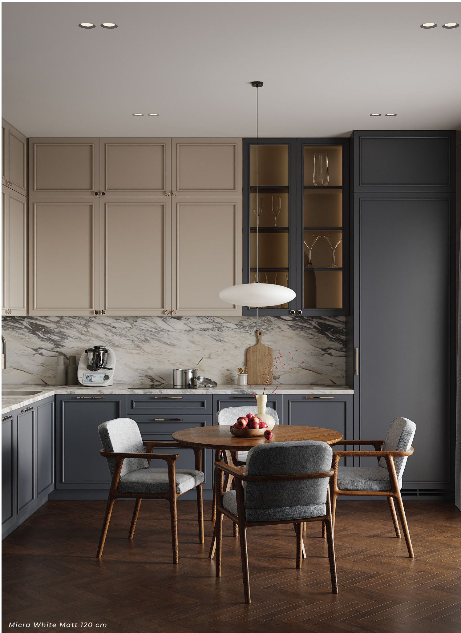
Micra White Matt 120 cm