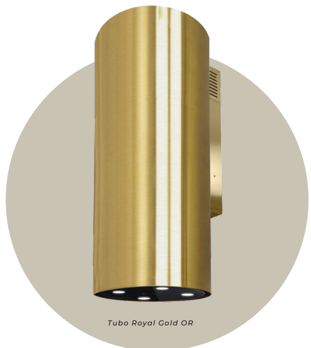
Tubo Royal Gold OR