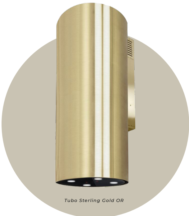
Tubo Sterling Gold OR